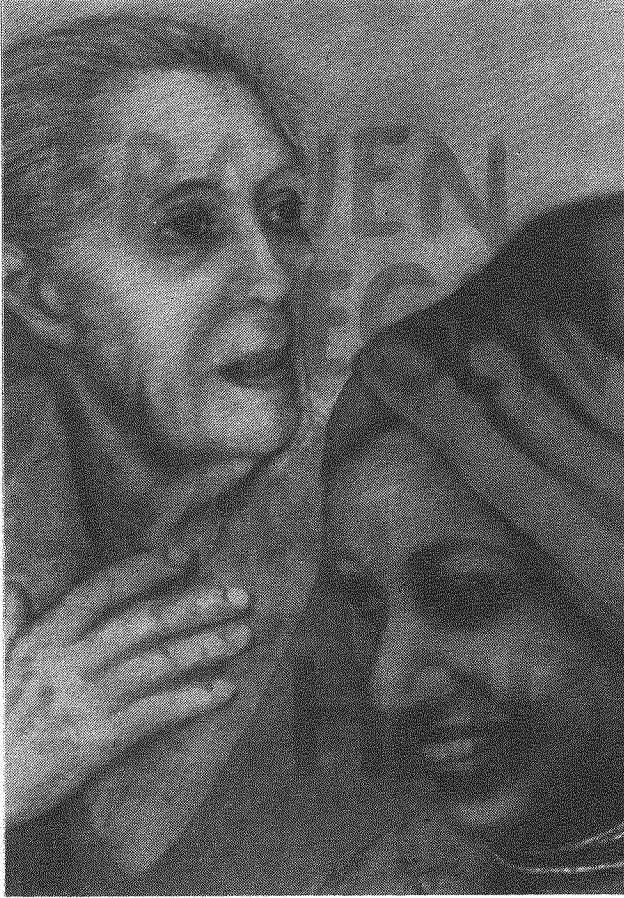
Frauen gegen Apartheid – Winnie Mandela

ren Kampf. Sie tat und tut es im Glauben daran, dass das Leiden für den Kampf um die Befreiung des schwarzen Volkes nicht aussichtslos ist. Dass sie dabei in einem tiefen Sinne «die Mutter des schwarzen Volkes» geworden ist, bestreiten vielleicht nicht einmal mehr ihre grössten GegnerInnen. Bis an die Grenzen des Erträglichen hat sie zu spüren bekommen, was Leiden und Qualen sind. Weil sie aber die Inkarnation des schwarzen Geistes (geworden) ist, gibt sie allen in ihrem Volk die spirituelle Kraft zu kämpfen. (Buthelezi)