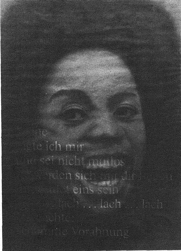
Schwarz wie ich bin

für ihr Recht, sich ihre eigene Wahrnehmung zu erhalten, kämpft sie dafür, sich zu achten und zu akzeptieren. Mein Widerstandskampf als weiße Frau verbindet sich an diesem Punkt mit demjenigen von Audre Lorde und ich kann viel von ihr lernen. Gerade weil sie eindeutiger von Vernichtung bedroht ist, hat sie eindeutiger an ihrem Widerstand arbeiten müssen und ist mir weit voraus in der Liebe zu sich selbst. Es ist zutiefst ermutigend, erleben zu dürfen, wie stark eine Frau sein kann, wie sie wirklich die Macht der Erotik verkörpert und wie wir etwas sehen können von dem, wozu wir gerufen sind zu werden. Ich will Audre Lorde nicht verklären. Aber ich will die Ermutigung, die sie für mich ist, benennen und die Sehnsucht in mir, so zu werden – nicht eine andere Frau kopierend, sondern ausgehend von meinen Möglichkeiten.