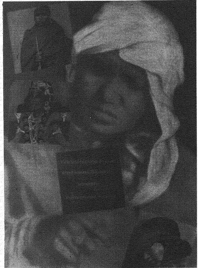
Phoolan Devi – eine indische Banditin

Ich denke aber auch an die Frauen hier in der Schweiz oder sonst in Europa. Ihr Ueberlebenskampf begann mit dem Einfordern von Kinderspielplätzen, mehr Lebensraum für ihre Sprösslinge. Sie merkten, dass die Strassen, Industrie- und