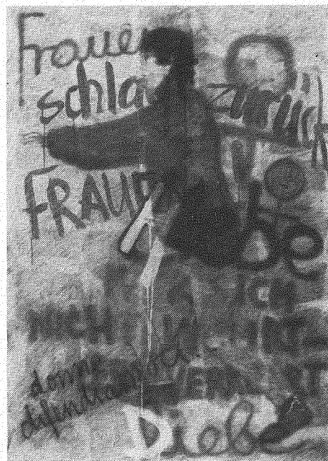
Liebe-Diebe-Hiebe – Frauen schlägt zurück

Widerstand, in-dem frau schweigt? Totale Kapitulation? «In der Sprache verschmelzen also unvermeidlich Unterwerfung und Macht. Wenn man die Freiheit nicht nur die Kraft nennt, sich der Macht zu entziehen, sondern auch und vor allem die,