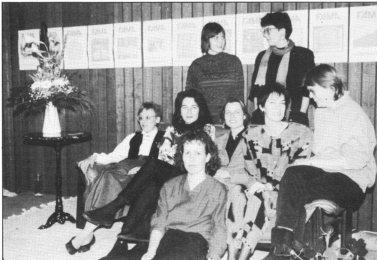
Das Bild hat die Fotografin Georgette Baumgartner am 26. Januar 1989 an unserem Fest zum 5-jährigen Bestehen der FAMA gemacht.

Die Leserin, der Leser, welcheR die frisch gedruckte FAMA aus dem Briefkasten nimmt, macht sich wohl wenige Gedanken darüber, welche Arbeitsgänge von der Themenauswahl bis zum Versand nötig sind. Die Grundstrukturen dieses Arbeitsrhythmus haben wir bereits in der Anfangszeit entwickelt. In