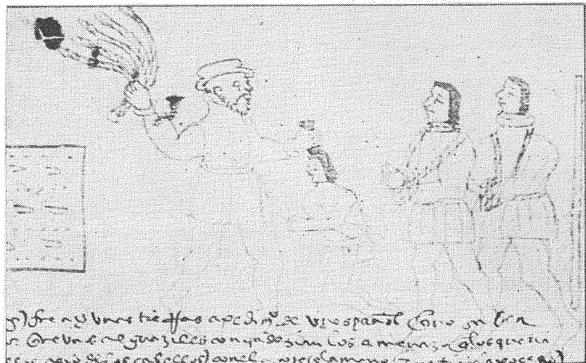
Zeichnung eines mexikanischen Indianers: Ein Spanier misshandelt einen Eingeborenen

1540 Pedro de Valdivia beginnt mit der Besiedlung von Chile.