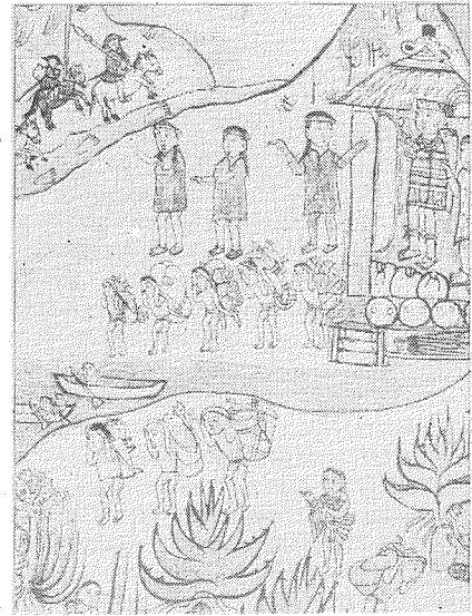
Indianische Zeichnung: Flucht vor den Eroberern

Gold und andere Bodenschätze, Gewürze und Holz verlockten die Europäer zur Invasion auf dem süd- und mittelamerikanischen Kontinent.