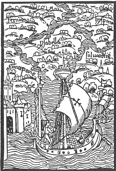
Karte der Entdeckungen des Christoph Kolumbus

In einem langsamen Prozess wurden die Jäger und Sammler sesshaft und begannen eine intensive Landwirtschaft. Die Besiedlung konzentrierte sich im zentralen Andengebiet und in Mittelamerika.