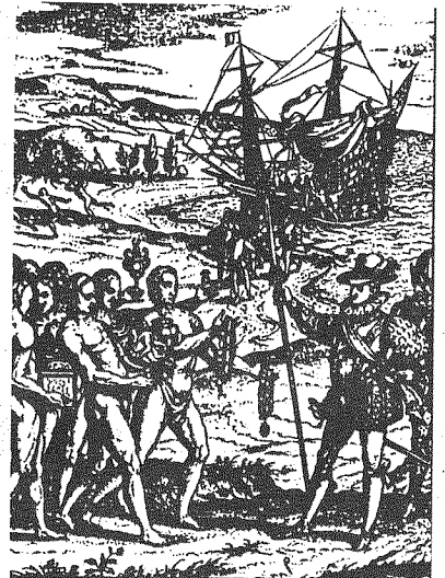
Zeitgenössischer Stich: Landung in Brasilien.

Nationalstaatliche Interessen, Konflikte und Grenzen spalten die indianischen Völker. Staatliche Indianerschutzpolitik versucht, die IndianerInnen in die nationalen Gesellschaften zu integrieren und zielt auf die Übernahme ihres Landes für kapitalwirtschaftliche Ausbeutung ab. Bei Verfassungsreformen in den letzten Jahren werden die Rechte der IndianerInnen grösstenteils verankert, in der Praxis setzt man sich noch immer über ihre Forderungen hinweg.