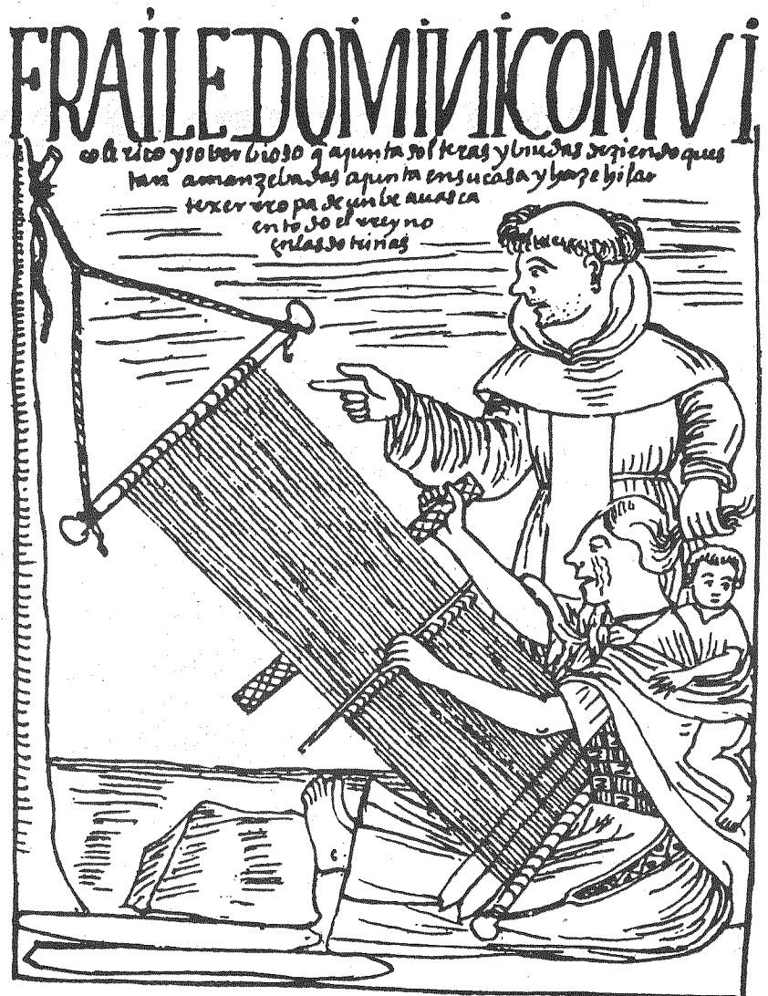
Auszug aus dem Artikel: Die eroberte und vergewaltigte Frau, in: Concilium , Heft Nr. 6, Dez. 1990, 490-95.

Bereits auf dem Schiff wurde sie von dem Priester Juan Díaz getauft. In der gleichen Nacht noch, als das Schiff nach Kuba zurückkehrte, wurde sie von Grijalva vergewaltigt. Nach seiner Ankunft auf der Insel ging er wieder zu seiner