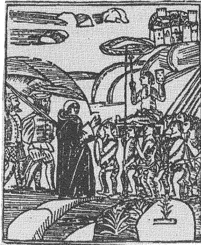
Der Inkaherrscher Atahualpa besucht Pizarro in seinem Lager. Der Mönch, der ihn begrüsst, lenkt ihn ab, und auf ein Zeichen Pizarros wird sein Gefolge niedergemetzelt und er selbst gefangen genommen.

Die 1503 eingeführte Encomienda verpflichtete die IndianerInnen zu Abgaben und Arbeitsleistungen. Dafür wurde ihnen Schutz und Unterweisung in christlicher Lebensweise zugesagt. In der Praxis erweist sich die Encomienda als Sklaverei.